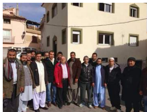
Miembros de la comunidad islámica de Utrillas y se ve la mezquita erguida detrás