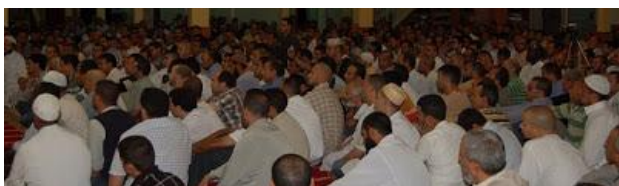
Mezquita de Terrassa

La Generalitat ha actualizado el mapa de las religiones de Cataluña, que recoge con datos de 2013 las cifras con distribución comarcal de los lugares donde se realiza culto de forma habitual. El estudio contabiliza un total de 7.958 centros por todo el territorio catalán, correspondientes a 13 confesiones religiosas.