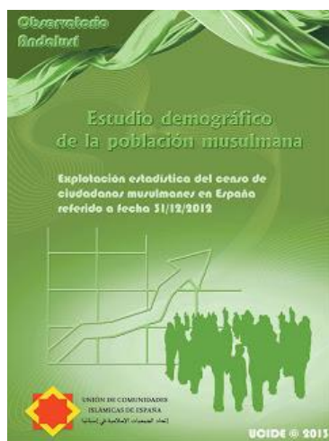
Población musulmana en España

De entre las cinco escuelas reconocidas universalmente, los ritos malekí y hanafí (suníes) son los más extendidos en España para la práctica del culto islámico, seguidos en menor medida del chafeí y del hanbalí, también zunitas, y del yafarí (chií). De todas ellas se distinguen algunas pequeñas y apreciadas cofradías sufíes.