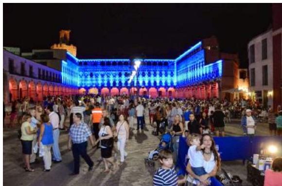
Los pacenses han disfrutado de una noche esplendida

La comunidad musulmana ofreció una degustación de Té y pasteles típicos árabes, en la sede de la Concejalía de Cultura, sita en la calle Soto Mancera, causando una gran sensación entre los visitantes pacenses que acudieron al acto de la Jornada .