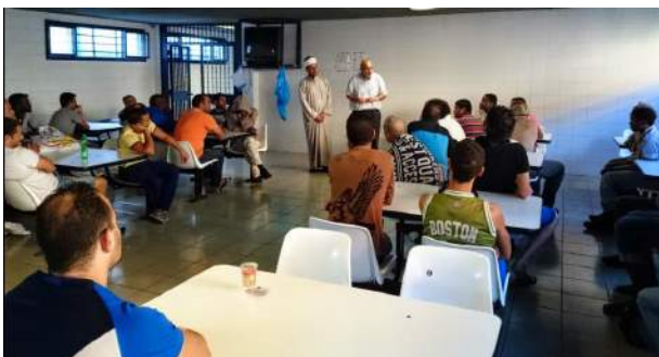
Visita a un CIEx de Valencia, ramadán 2014

La Comisión Islámica de España envía el borrador del convenio de Asistencia religiosa islámica con los CIEs a Justicia e Interior con las siguientes manifestaciones.