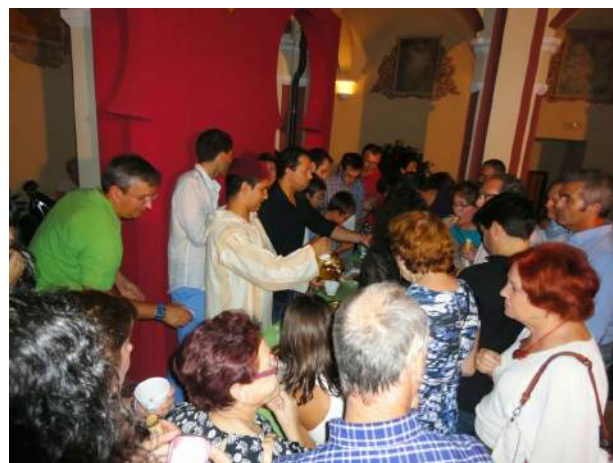
Degustación de té y pasteles árabes en la Concejalía de Cultura

La comunidad islámica de Badajoz ha participado ayer sábado, día 6 de Septiembre en la Noche Blanca de Badajoz, que ha organizado la Concejalía