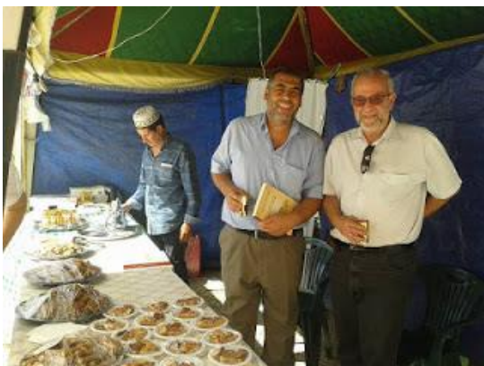
Con el Director del Museo Arqueológico de Badajoz

Mossassa “para repasar nuestra historia, para recordar viejas gestas, para ponernos al día,pequeños y mayores, en el conocimiento de nuestro intenso pasado. Una historia que por más que se estudie nunca deja de sorprender porque cada acontecimiento, cada personaje y cada monumento van dejando una huella en los libros pero también en el alma de una ciudad que mira atrás con orgullo y devoción. “