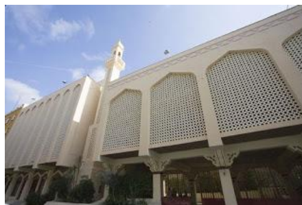
Mezquita Central de Madrid 1988-2013